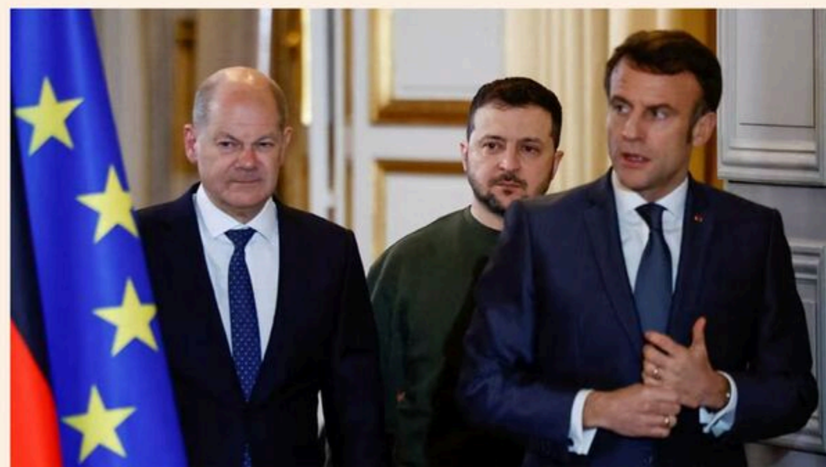
EU leaders last week agreed to pay €50bn over four years to keep Ukraine's economy and budget afloat

Berlin wants different rules on how €50bn funding for Kyiv-bound weapons should work