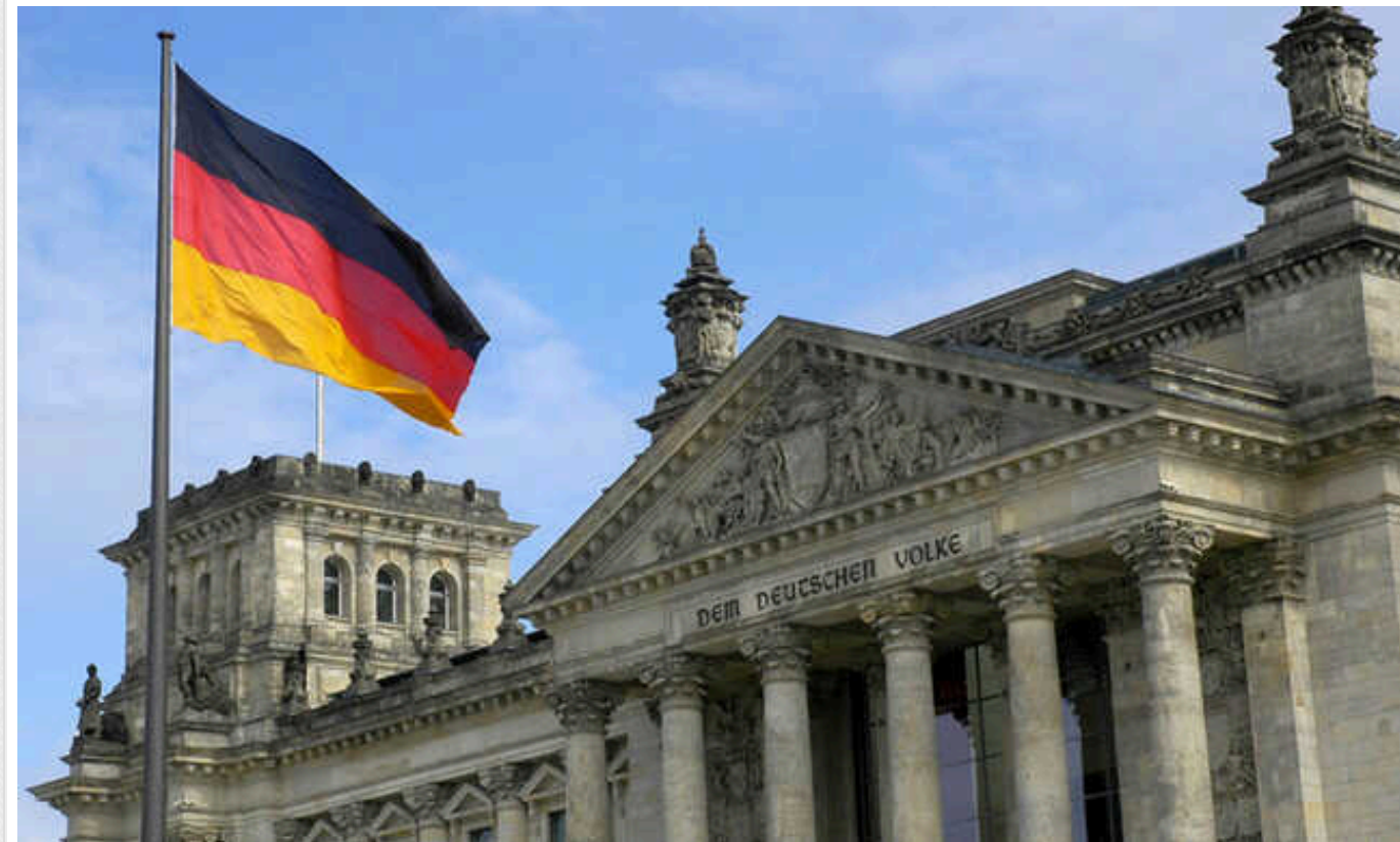
Позиція Німеччини щодо фонду військової підтримки ЄС може затримати постачання зброї до України, - Financial Times

Європейський фонд миру в 12 млрд євро вичерпався, обговорюється його поповнення на 5 млрд. Країни роблять у нього внески залежно від розміру економік, а потім отримують компенсацію за зброю, яку передала Україні.