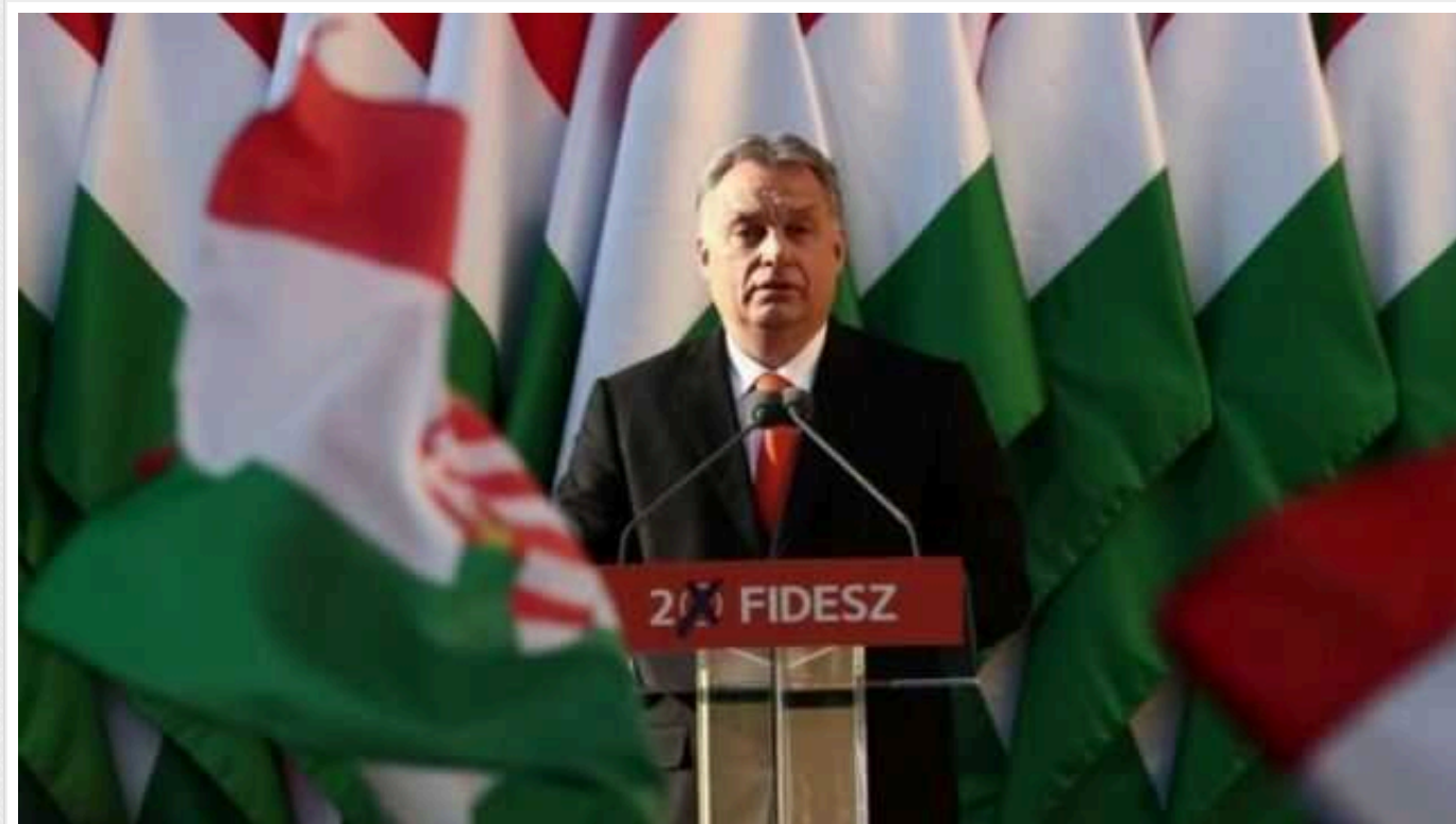
Депутати партії Орбана не прийшли на засідання парламенту про вступ Швеції в НАТО

Депутати угорського прем'єр-міністра Віктора Орбана бойкотували парламентське засідання щодо вступу Швеції до НАТО, що призведе до подальшого гальмування приєднання країни до Альянсу.