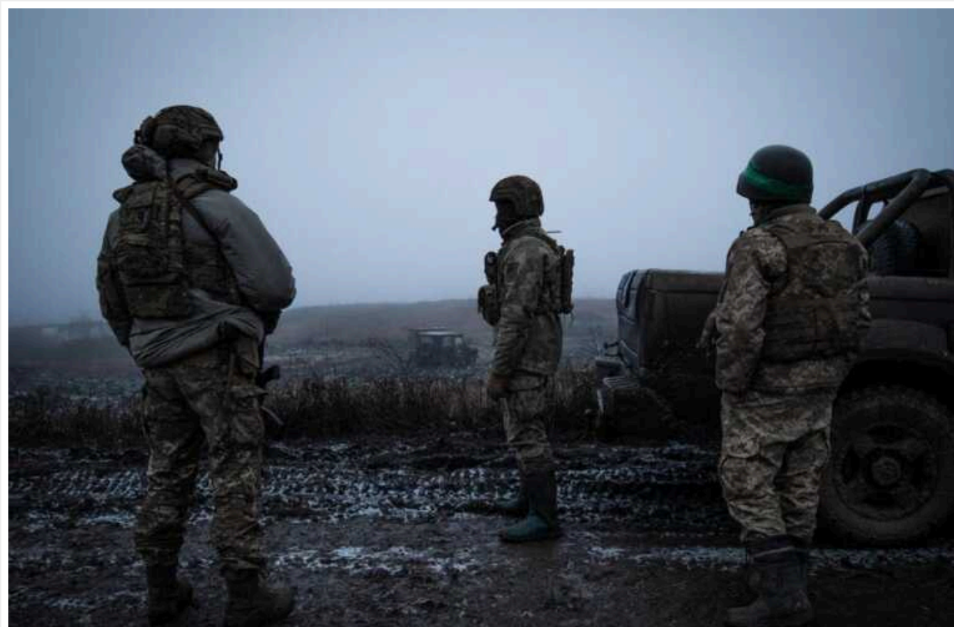
Окупанти під Куп'янськом концентрують значні сили: у РНБО оцінили загрозу