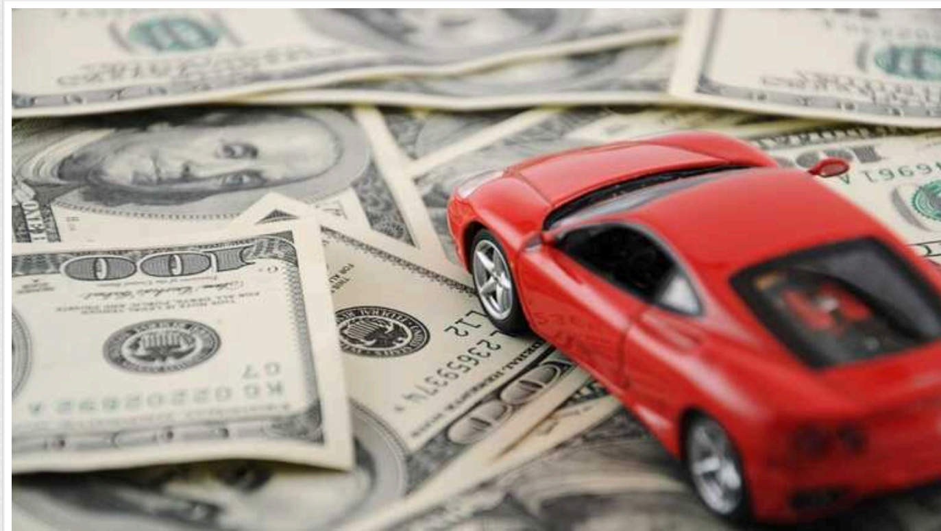
Податок на розкіш в Україні: за які авто доведеться додатково заплатити у 2024 році

Транспортний податок в Україні залежить від розміру мінімальної зарплати. Але, проти те, що рівень мінімалки у 2024 році збільшиться, список автомобілів, за які громадянам потрібно сплатити податки, скоротився.