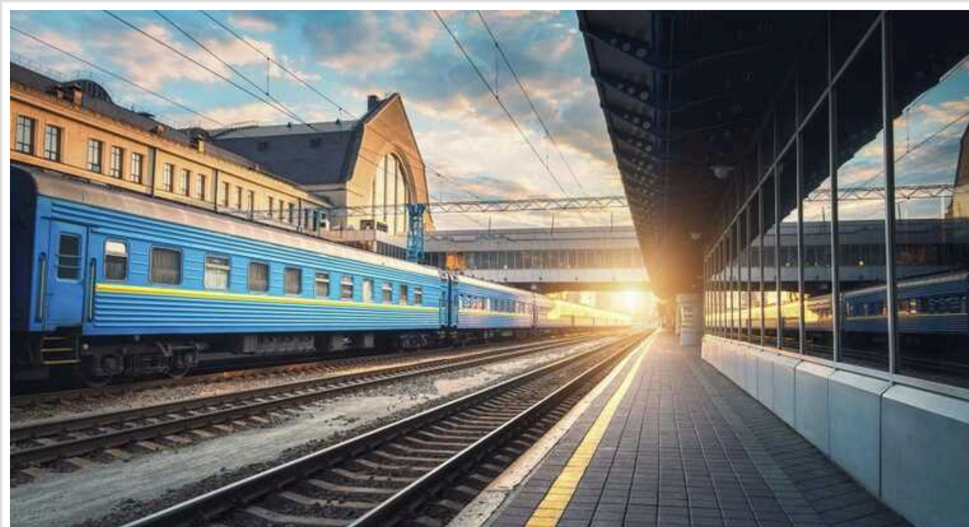
"Укрзалізниця" може залишитись без постачальника рейок

Після початку широкомасштабного вторгнення російських військ на територію нашої країни українська залізнична інфраструктура зазнає значних пошкоджень. Для відновлення залізничних колій АТ «Укрзалізниця» вимушено здійснювати закупівлю рейок за кордоном, оскільки, єдиним постачальником рейок до лютого 2022 року для потреб української залізниці був металургійний комбінат Азовсталь.