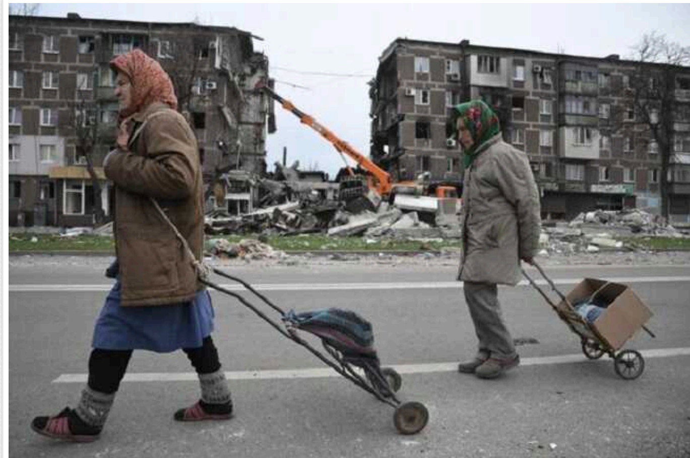
Жителі Маріуполя спростували брехню віцепрем'єра РФ про відновлення свого житла

Віцепрем'єр РФ Хуснуллін заявив, що в окупованому Маріуполі відновлено майже всі багатоквартирні будинки.