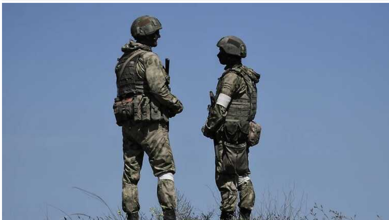
DeepState: Окупанти просунулися на півночі Авдіївки та в Первомайському

Російські окупаційні війська за останній час незначно просунулися на двох ділянках