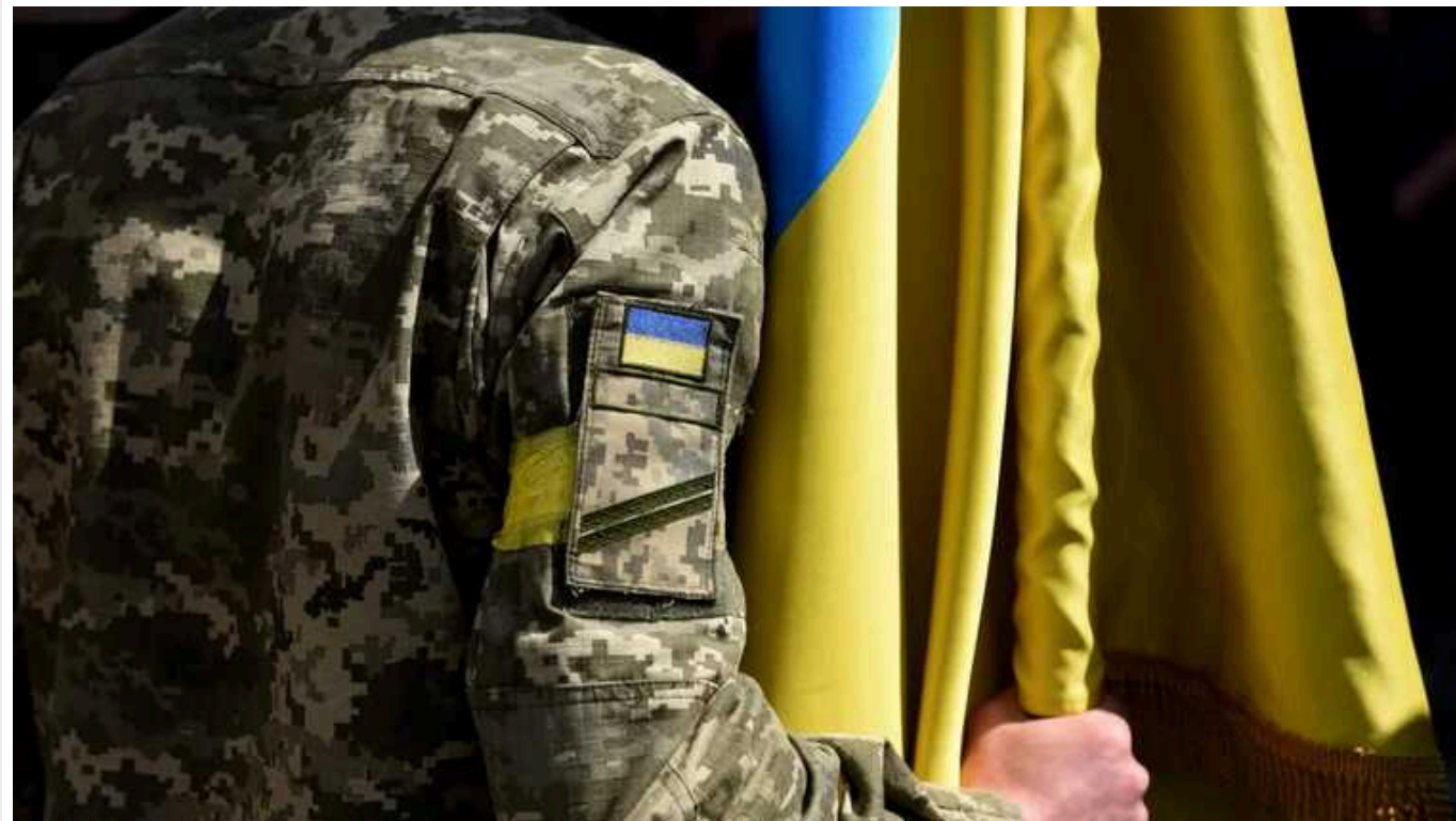
Суд на Хмельниччині дав відповідь чи можуть мобілізувати, якщо не виповнилося 27 років

Під час дії воєнного стану мобілізації підлягають громадяни до 27 років, які є резервістами та військовозобов'язаними у запасі й не заброньовані в установленому порядку на період мобілізації, заявив Ізяславський районний суд Хмельницької області. Він засудив до 3 років позбавлення волі ухилинта, який вважає, що призвати можуть лише з 27-річного віку.