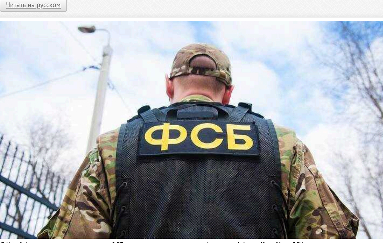
В Україні викрили агентурну мережу ФСБ: корегувала вогонь окупантів по техніці та підрозділах ЗСУ

На південному сході України викрили агентурну мережу ФСБ РФ, члени якої карували обстріл російських терористів по українських військовослужбовцях. Зрадники наводили ворожий вогонь по техніці та підрозділах ЗСУ.