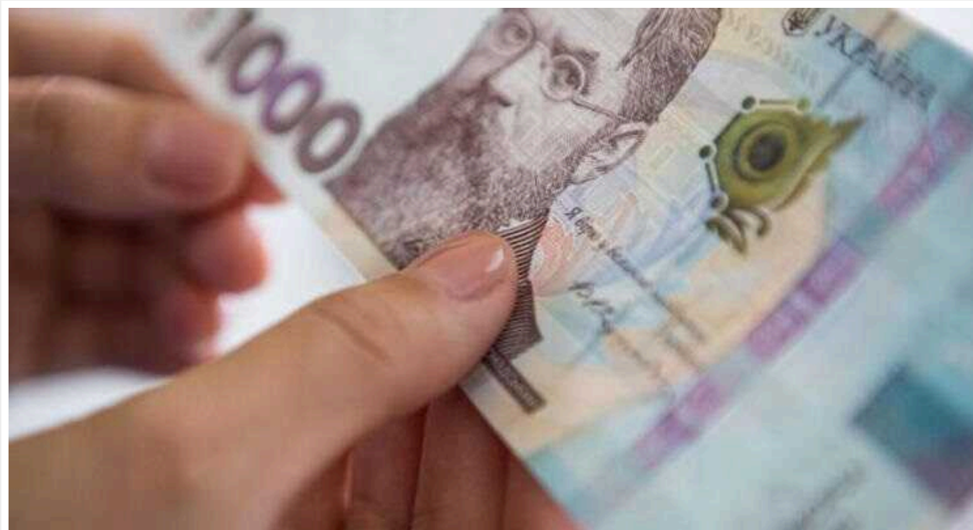
Україна більше не зможе платити пенсії грошима США

У законопроекті Сенату щодо допомоги Україні прописано, що пряма бюджетна підтримка США не може бути використаною на відшкодування пенсій.