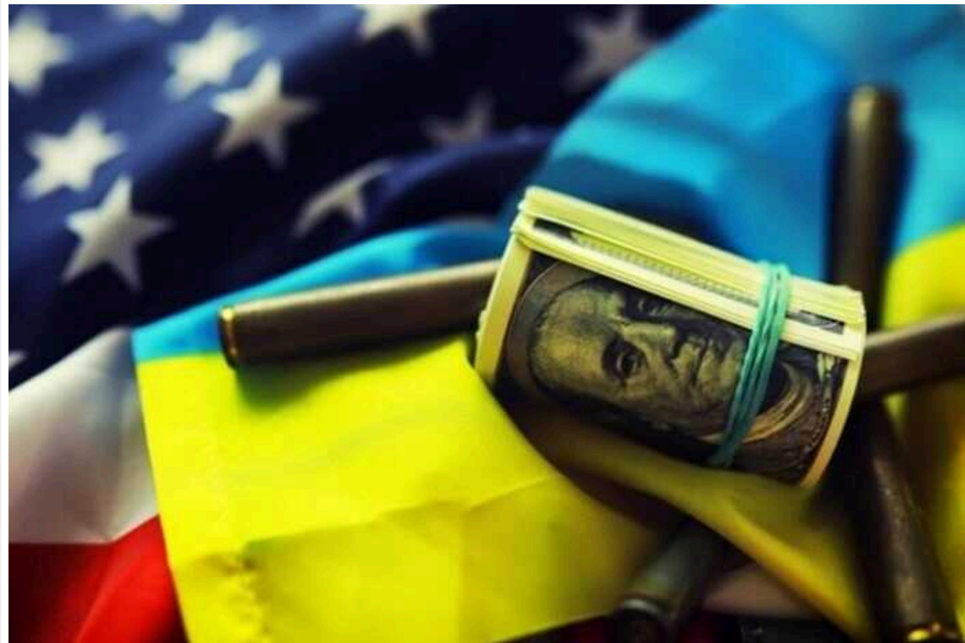
Bloomberg: На Заході придумали спосіб фінансувати Україну за рахунок Росії

Європейський Союз та країни G7 ("Великої сімки") шукають способи застосування заморожених активів Росії для фінансування України. Зокрема, вони обговорюють план використання понад 250 млрд доларів із заблокованих активів російського Центрального банку в якості застави для допомоги у фінансуванні відновлення країни.