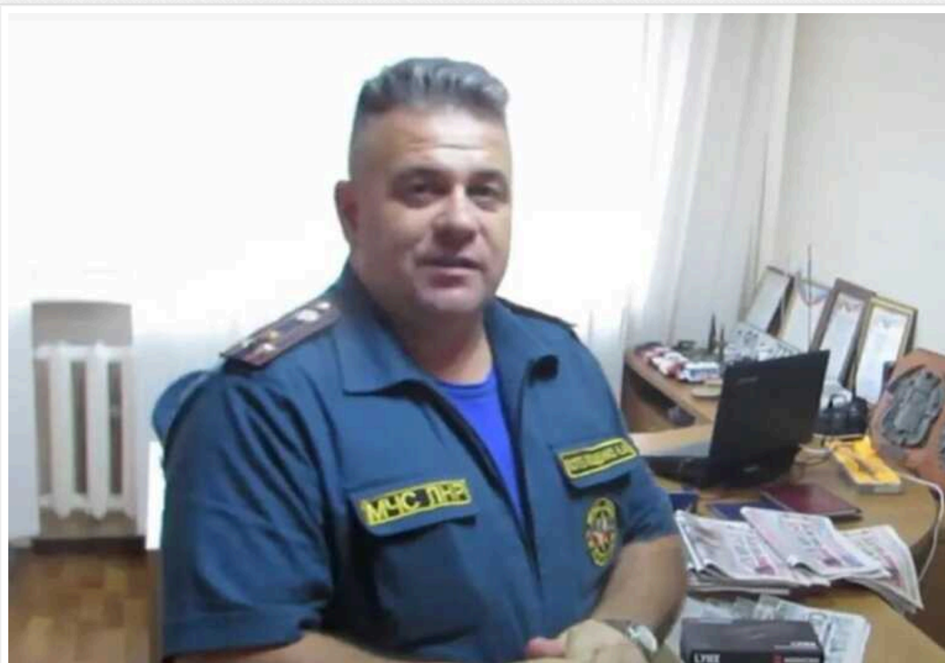
ЗСУ ударом по Лисичанську ліквідували "міністра НС" окупантів

Окупаційний керівник "МНС ЛНР" Олексій Потелещенко 3 лютого був ліквідований внаслідок удару ЗСУ по окупованому Лисичанську Луганської області.