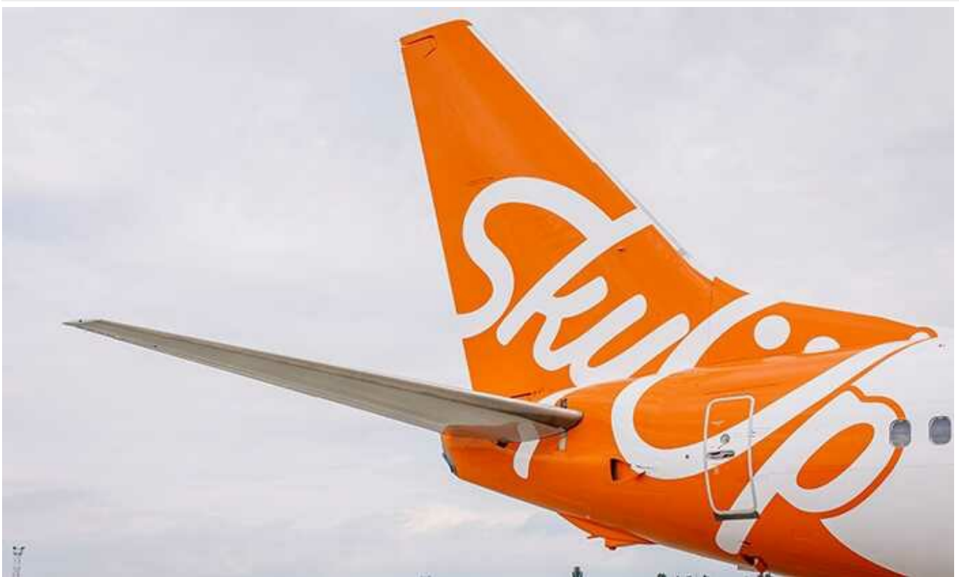
SkyUp без конкуренції отримала 79 мільйонів на закордонні польоти керівництва України

Державне авіаційне підприємство «Україна» Державного управління справами 25 січня за результатами тендеру замовило ТОВ «Авіакомпанія Скайап» послуги пасажирського повітряного транспорту і резервування літаків для виконання літерних перевезень на 78,76 млн грн.