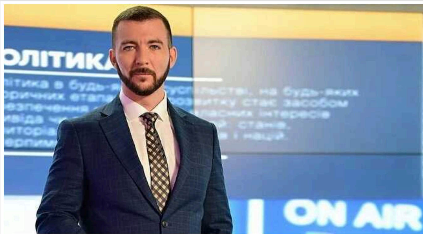
Пресекретар Президента України спростував повідомлення телеканалу RAI, де від імені Зеленського повідомили про патову ситуацію на фронті