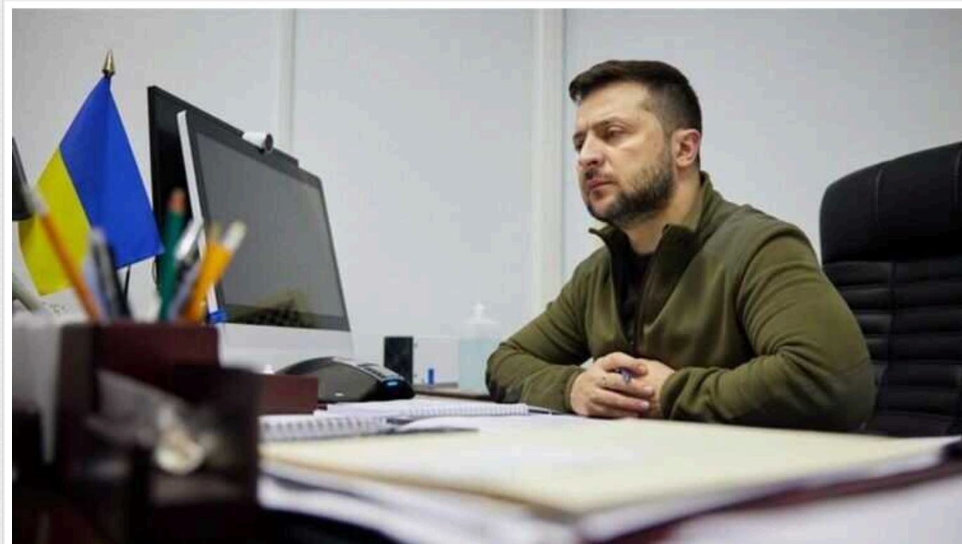
Зеленський запропонував Раді продовжити воєнний стан і мобілізацію

Президент Володимир Зеленський запропонував Верховній Раді продовжити термін дії воєнного стану та загальної мобілізації в Україні. Відповідні законопроекти №10456 та №10457 зареєстровані на сайті ВРУ.