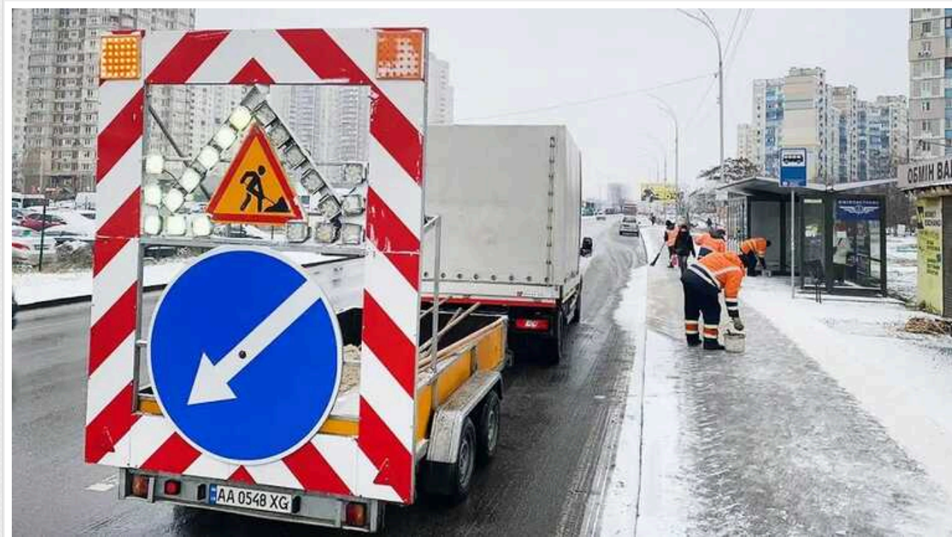
Через посилену мобілізацію Києву загрожує транспортний колапс

У Києві може посилитися криза транспорту через масштабну мобілізацію комунальників.