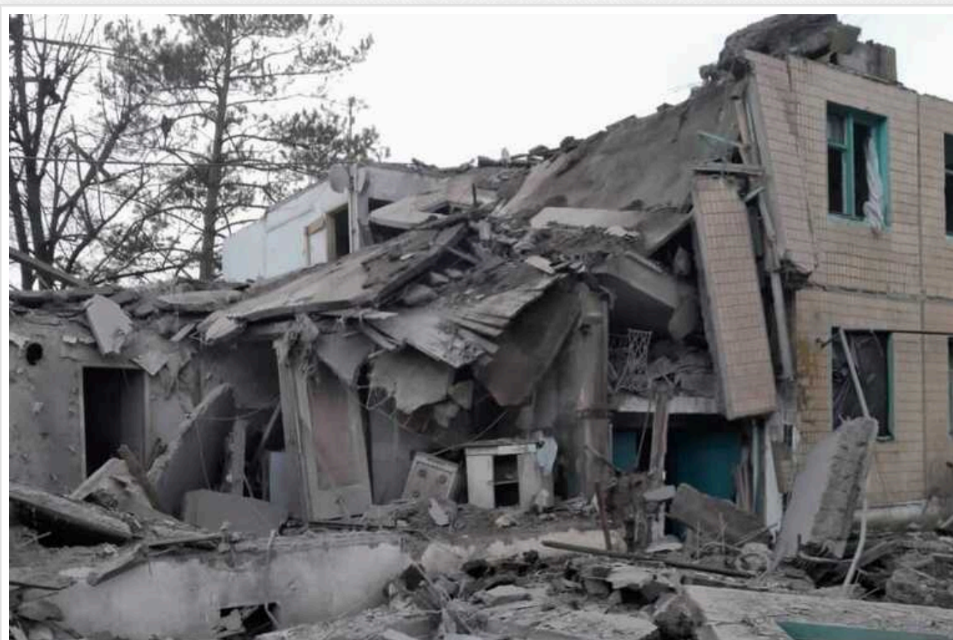
Окупанти обстрілюють Харківську область: були прильоти по підстанції у Васиївці Куп'янського району та по будівлі адміністрації та ЦНАП Вовчанська

Минулої доби в Харківській області були прильоти по підстанції у Васиївці Куп'янського району та по будівлі адміністрації та ЦНАП Вовчанська.