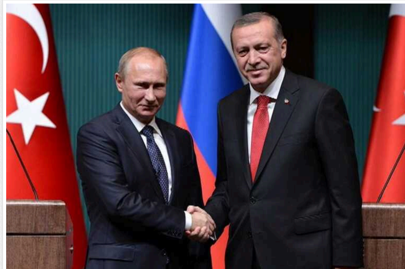
МЗС Туреччини: Ердоган обговорить із Путіним новий механізм експорту українського зерна

Президент Туреччини Реджеп Тайп Ердоган і президент РФ Володимир Путін під час зустрічі в Туреччині обговорять новий механізм експорту українського зерна через Чорне море.