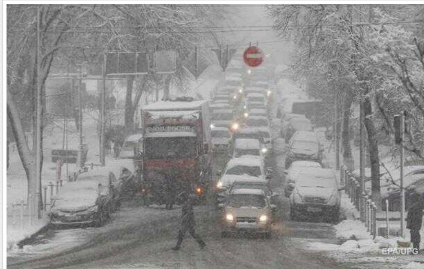
В Україну вривається потужний шторм зі снігопадами та сильним вітром

Погода в Україні 5 лютого буде місцями сніжною та дощовою. У цей день будуть дуже сильні пориви вітру.