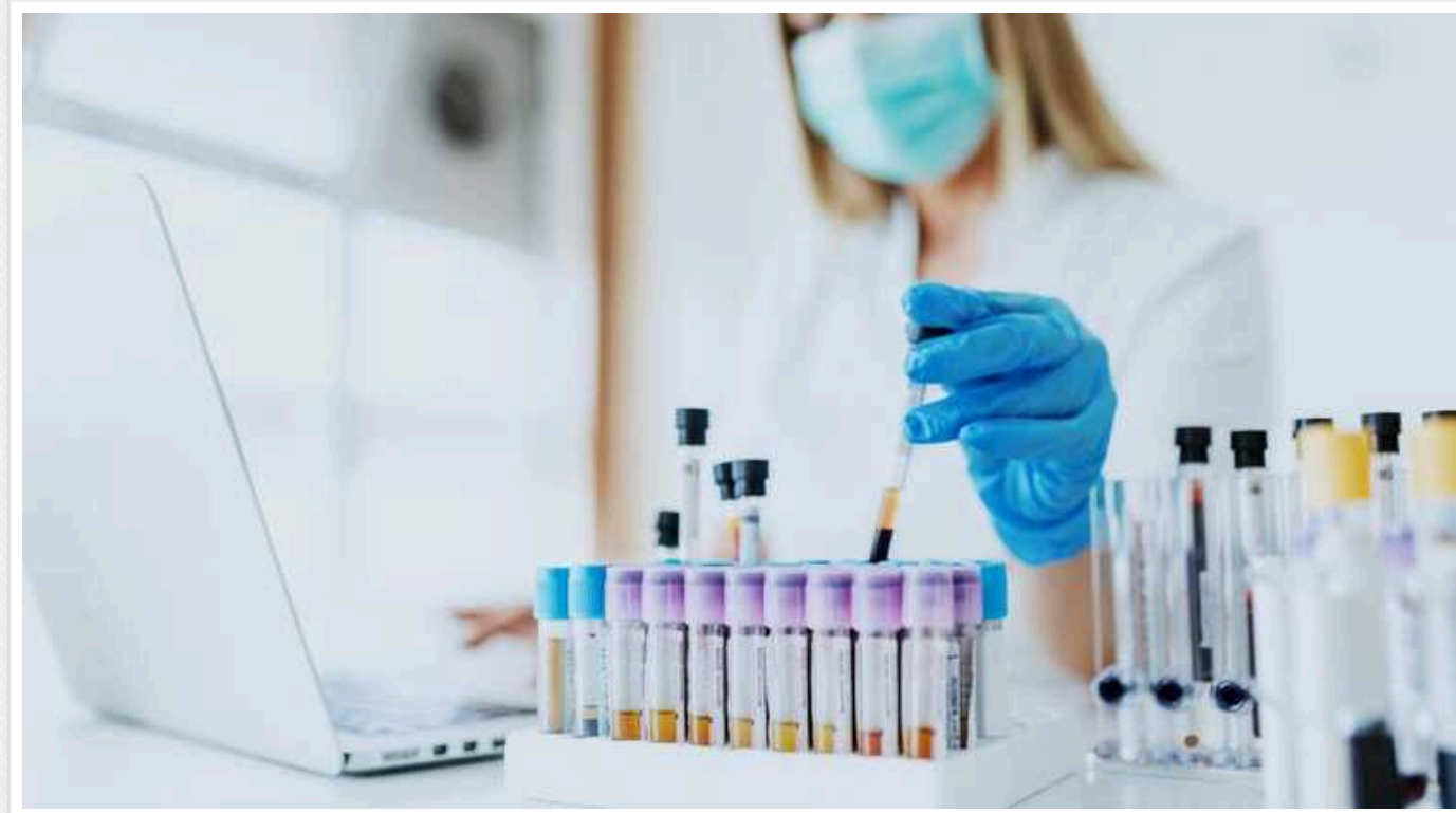
У МОЗ пояснили, чи можуть українці робити аналізи безкоштовно

В Україні пацієнти можуть здати низку аналізів цілком безоплатно, проте є кілька умов.