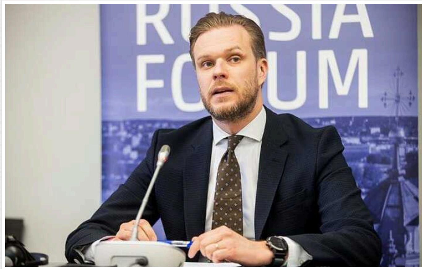
Лише рішучі дії Європи змусять РФ змінити свою поведінку, - МЗС Литви