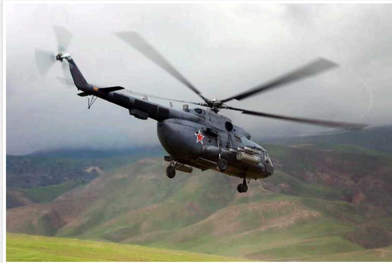
У РФ із радарів зник рятувальний вертоліт Ми-8: розгорнули пошукову операцію

У Республіці Карелія в Росії над Онезьким озером зник гелікоптер Ми-8 північно-західного авіаційно-рятувального центру МЧС. Екіпаж, що складався із трьох осіб, перестав виходити на зв'язок, коли здійснював тренувальний політ.