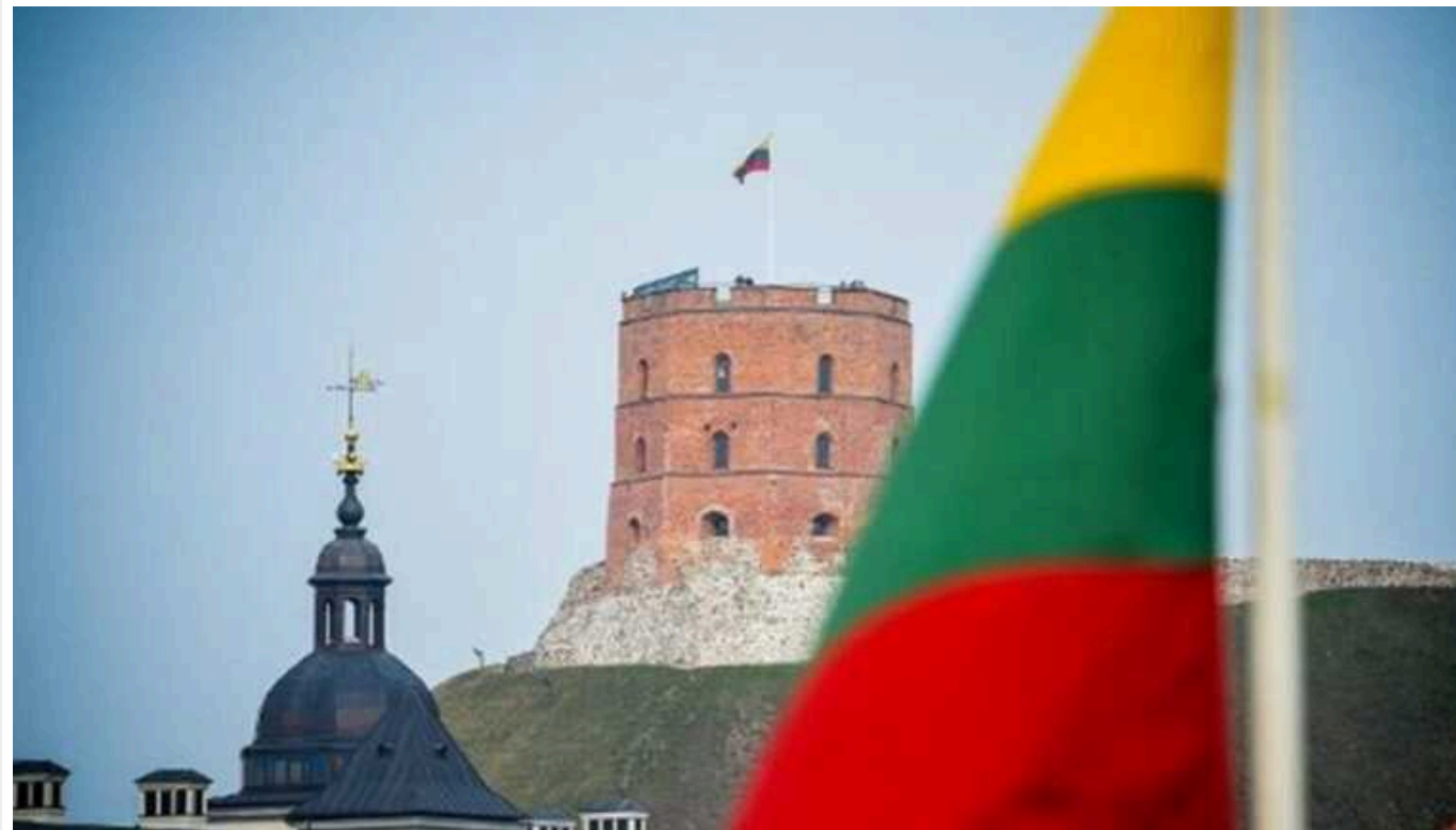
У Литві пропонують ще на рік відтермінувати для біженців з України вимоги щодо знання литовської мови

Міністерство освіти, науки і спорту Литви пропонує продовжити на рік термін, протягом якого українцям, які втекли від війни до Литви і влаштувалися там на роботу, треба буде вивчити литовську мову.