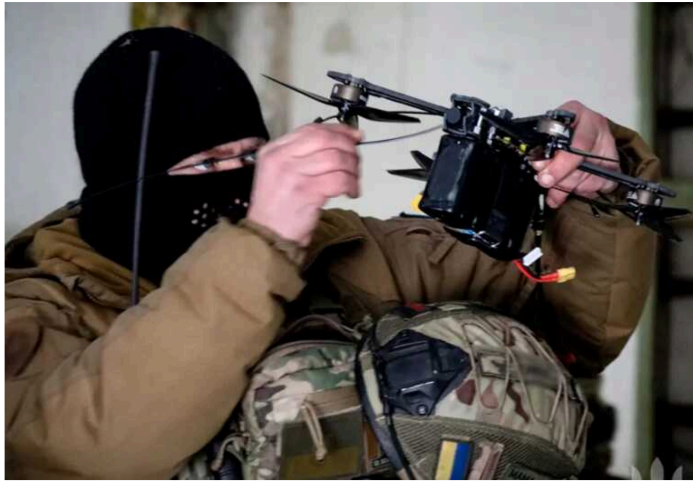
У НАТО переконані, що їхнім арміям не потрібні FPV-дрони, - Defense Express

Попри те, що дрони кардинально змінили поле бою в Україні, у НАТО досі відмовляються адаптувати свої військові тактики та лише шукають аргументи, чому дрони не потрібні.