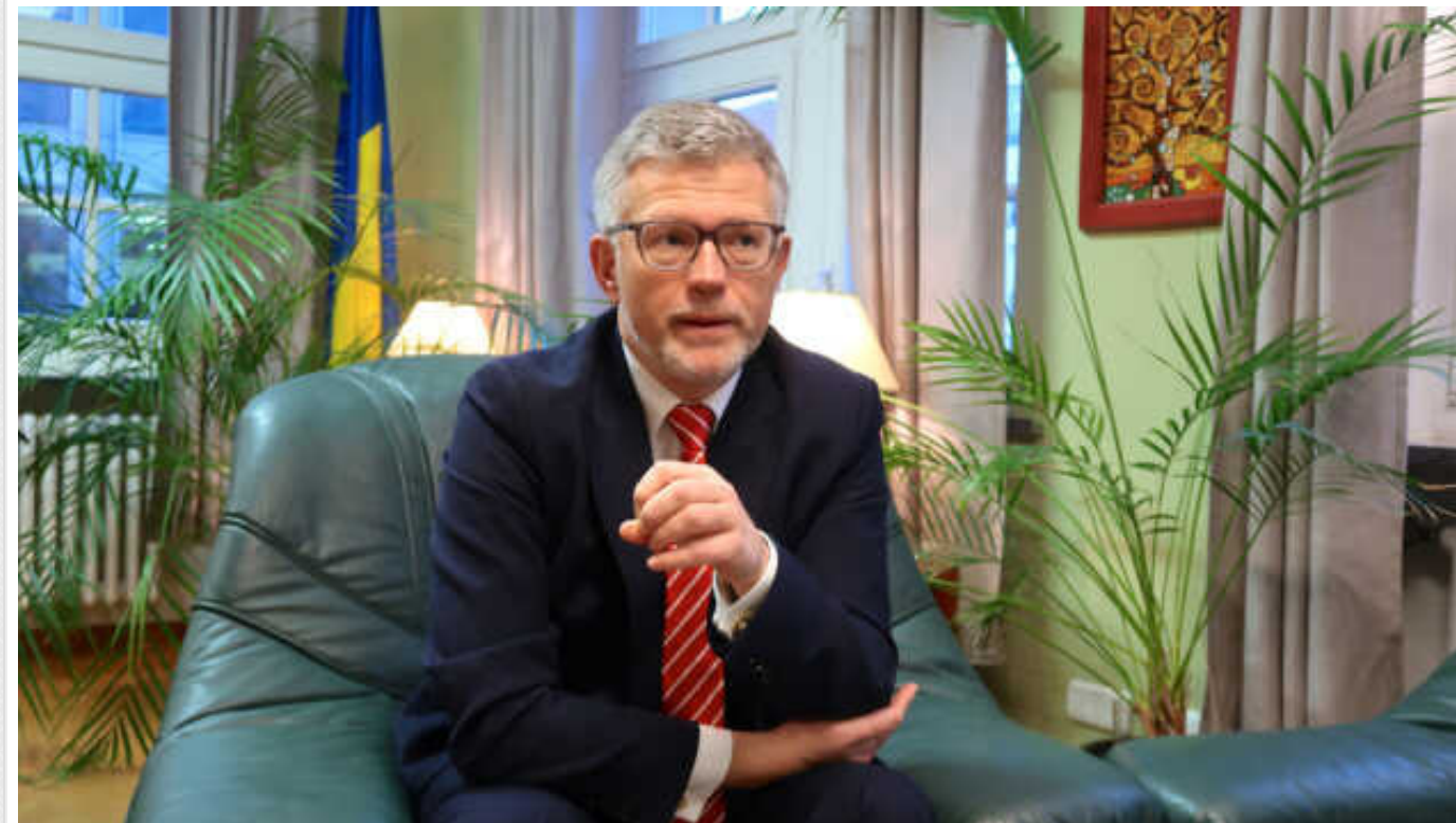
Посол України Мельник сподівається, що президент Бразилії не поїде в РФ, але відвідає Україну

Посол України в Бразилії Андрій Мельник висловив сподівання, що лідер Бразилії Лула да Сілва не поїде на саміт БРИКС у Росію, а зрештою здійснить візит до України.