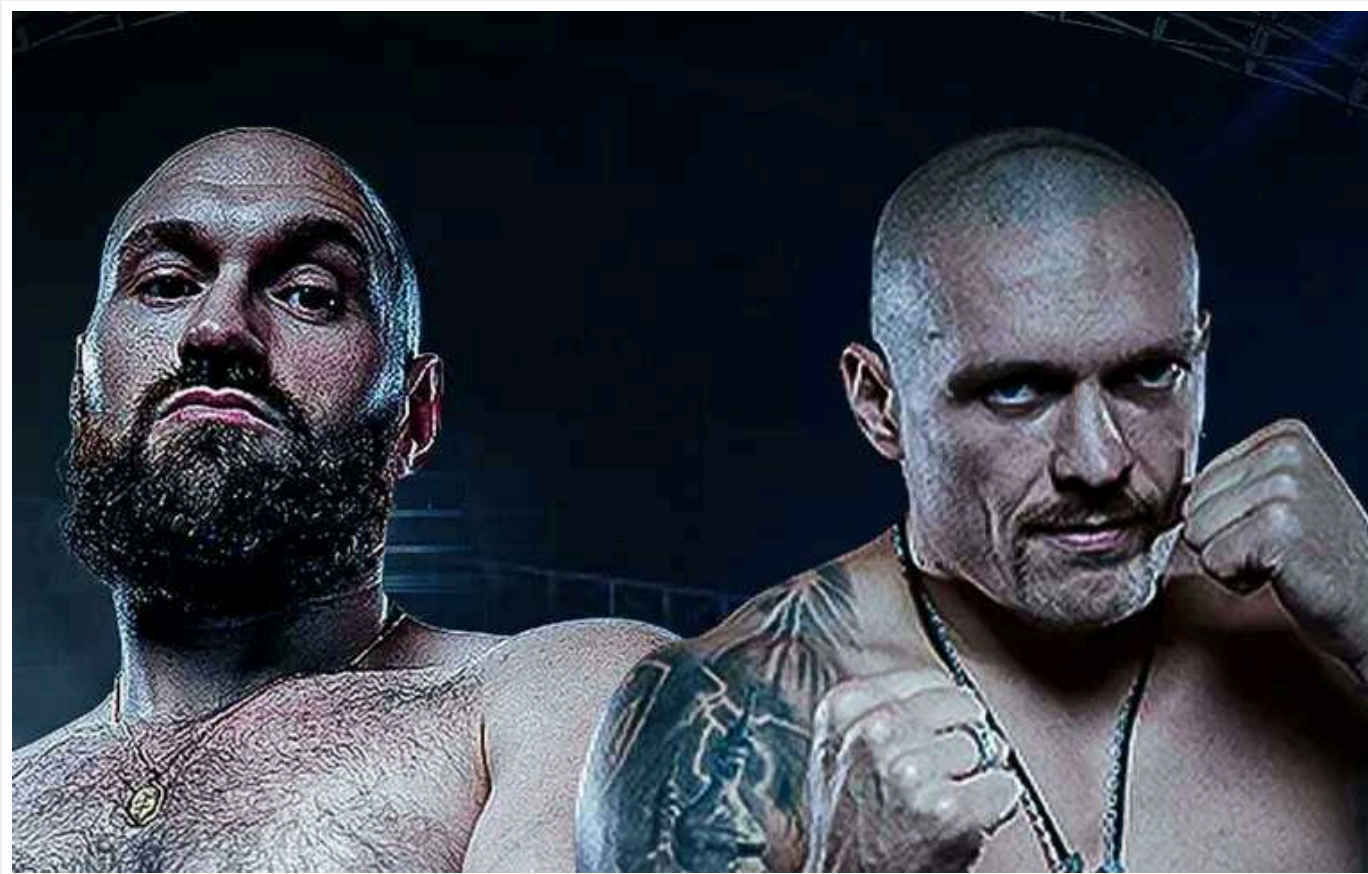
Якщо Ф'юрі ще раз зірве бій проти Усика, то його оштрафують

Організатори бою Усик - Ф'юрі внесли в контракт спеціальний пункт про санкції в разі повторного зриву поєдинку.