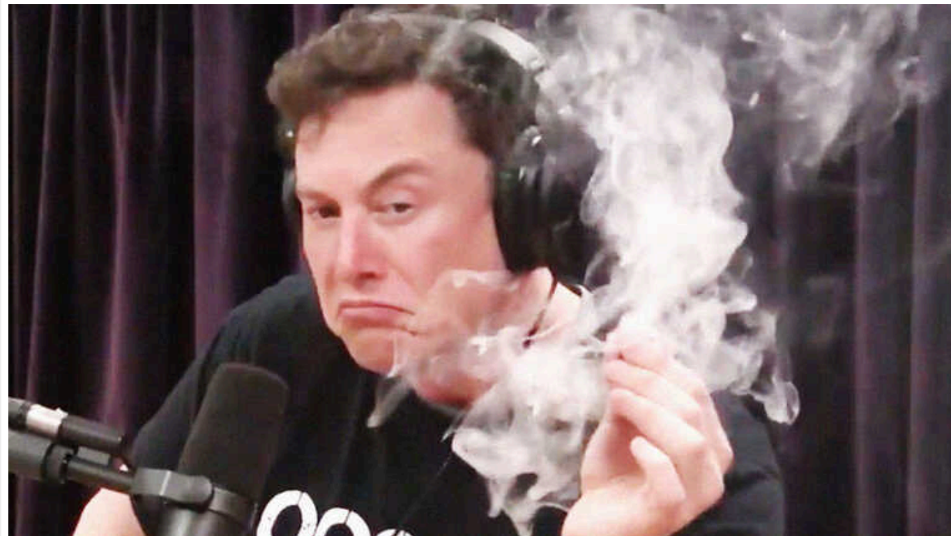
Історія з наркотиками та Ілоном Маском отримала продовження: підозра впала на топменеджерів Tesla та SpaceX

Топменеджери Tesla і SpaceX знали про вживання наркотиків мільярдером Ілоном Маском. До того ж вони самі часто вживали заборонені речовини разом із ним, аби залишатися "наближеними" та зберегти свої статус і гроші.