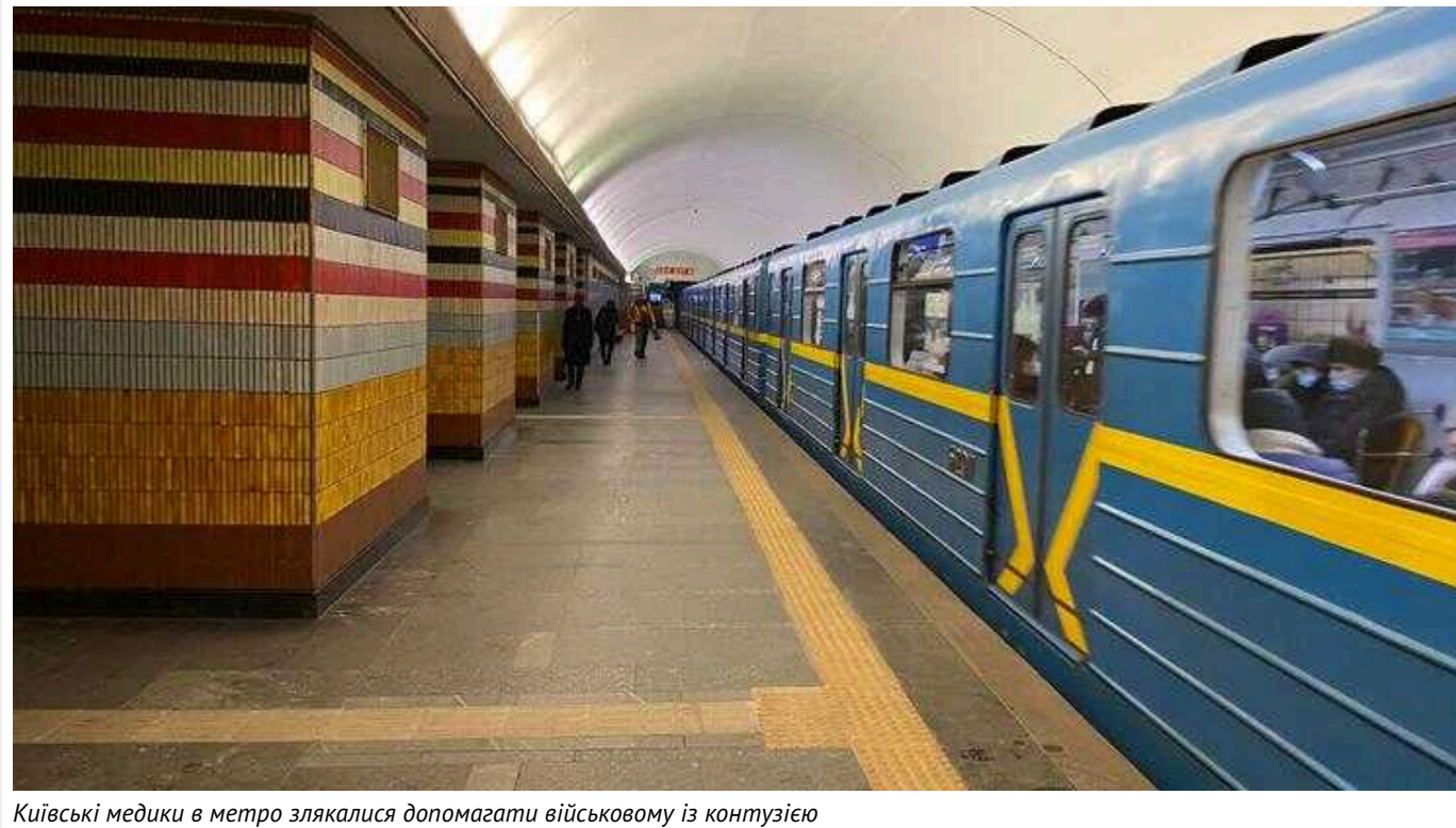
Київські медики в метро злякалися допомагати військовому із контузією

Ввечері 3 лютого у мережі поширили відео, як у київській підземці нібито стало погано військовослужбовцю з контузією. Автор ролика стверджував, що медики не надають йому допомогу і взагалі бояться підходити.