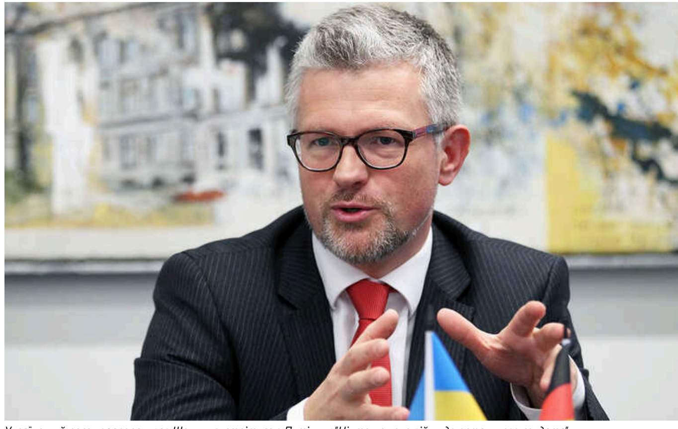
Український посол запропонував Шольцу зустрітися з Путіним: "Ніхто не хоче війни до останнього солдата"

Посол України в Німеччині Андрій Мельник заявив, що Захід має докласти більше дипломатичних зусиль для завершення війни в Україні. Дипломат, зокрема, запропонував ідею провести переговори із кремлівським диктатором Володимиром Путіним.