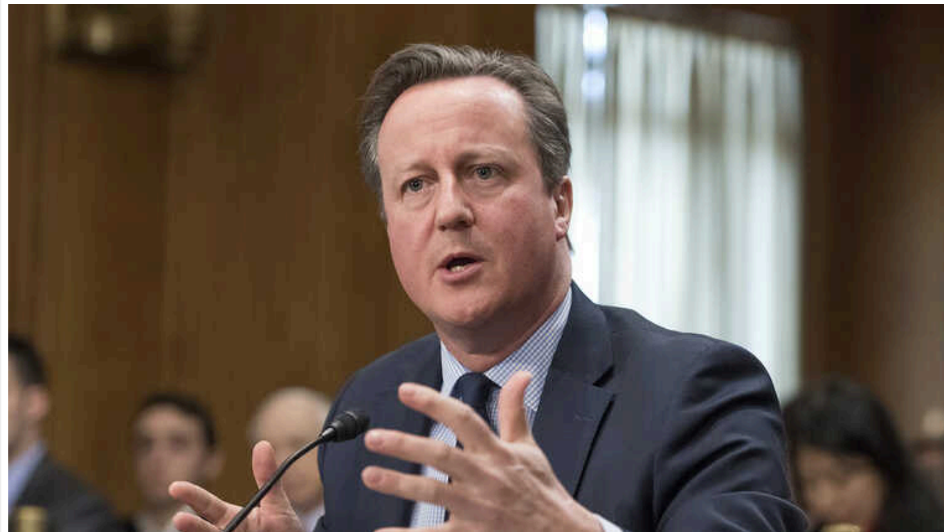
Потрібно припинити розмови про патову ситуацію і про те, що час не на боці України, - МЗС Британії

Міністр закордонних справ Великої Британії Девід Кемерон заявив, що Лондон повинен зробити все можливе, щоб згуртувати інші країни на підтримку України в загарбницькій війні, що проти неї веде РФ.