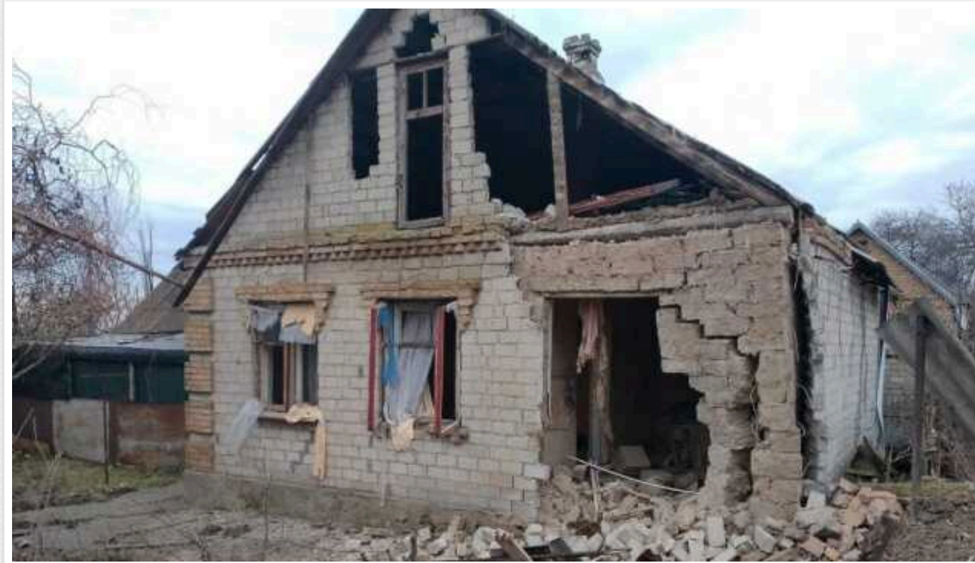
Ворог двічі вдарив по Нікополю з важкої артилерії: є руйнування

На Дніпропетровщині ворог двічі бив по Нікополю з важкої артилерії. Обійшлося без жертв. Зруйновано господарську будівлю.