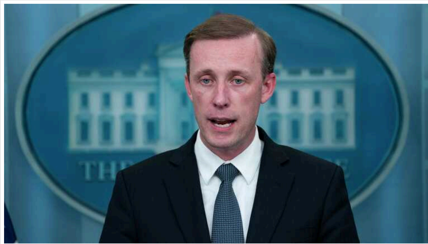
Сполучені Штати не втручатимуться у можливе рішення влади України про звільнення Головнокомандувача ЗСУ Валерія Залужного, – Джейк Салліван

Радник Байдена Джейк Салліван дав зрозуміти, що на Банковій радилися з американцями зі звільнення Залужного.