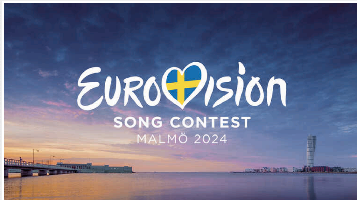
У Мінцифри дали пояснення чому "Дія" "впала" під час Нацвдбору Євробачення-2024

Українцям запропонували віддати свої голоси за переможця Нацвдбору Євробачення через "Дію", однак під час голосування застосують "ліз". Пізніше у Мінцифри пояснили, чому це сталося.