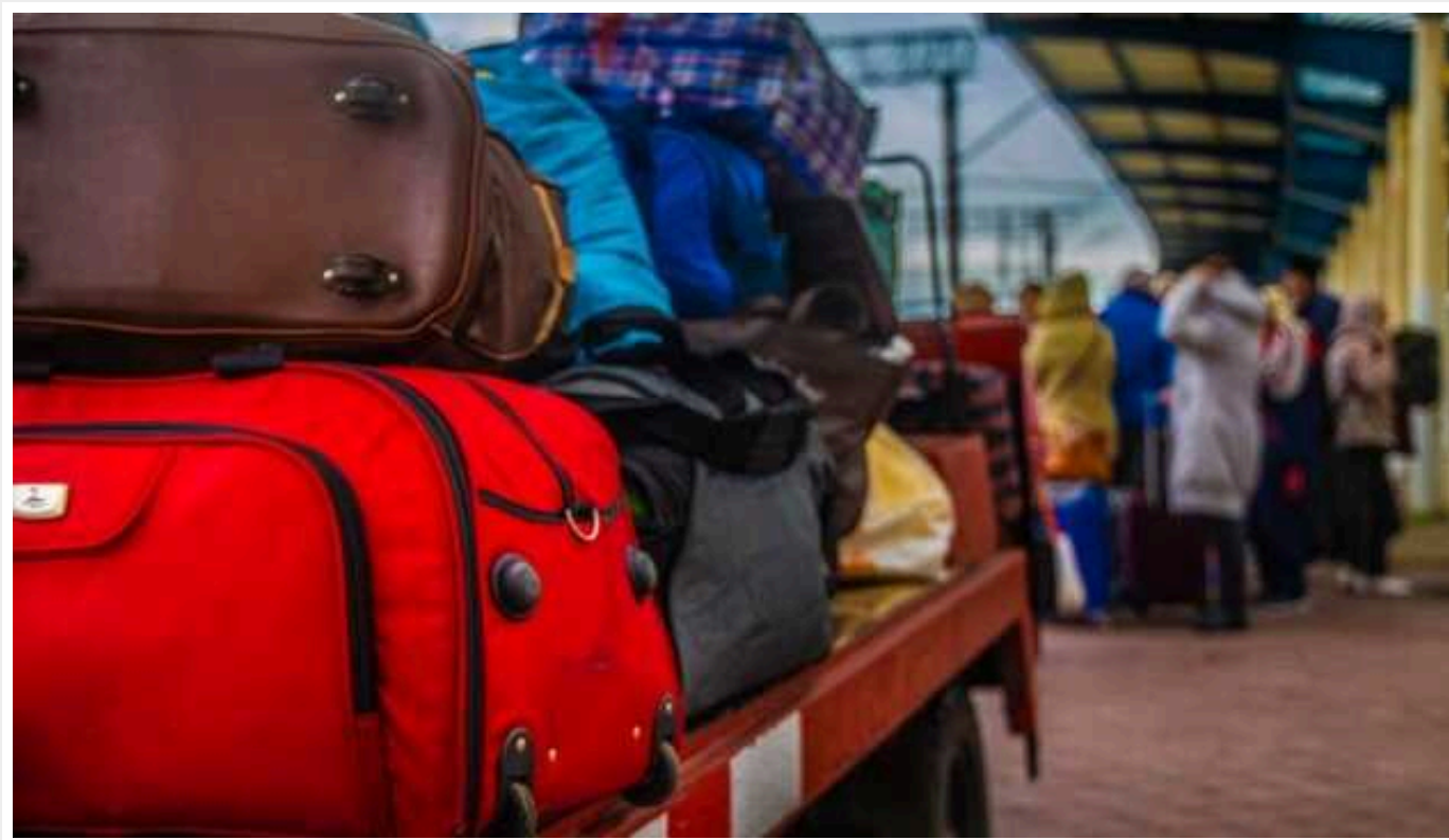
З прифронтових районів Херсонської області евакуювали ще 35 людей, серед них – троє дітей

З деокупованих територій Херсонської області евакуювали ще 35 людей, серед них – троє дітей.