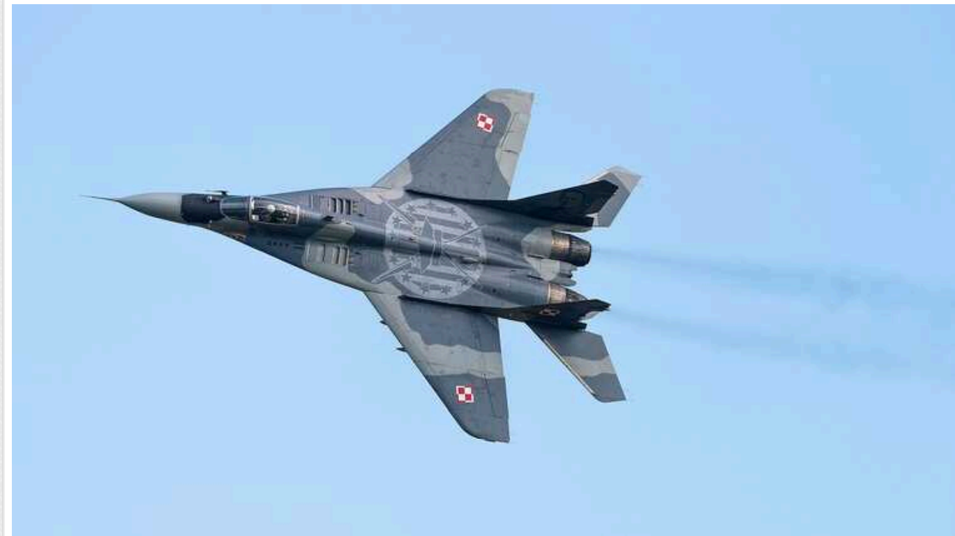
Польські військові попередили цивільні літаки про активізацію військової авіації біля східних кордонів Польщі

У Польщі видали навігаційне попередження для користувачів повітряного простору вздовж кордону з Росією та Білоруссю. У попередженні йдеться про можливість "незапланованої військової діяльності".