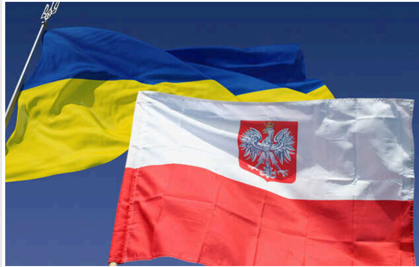
Більшість українців, які поїхали до Польщі цієї зими, жили в областях Західної України, — Gremi Personal

Цієї зими найбільше українців, що знаходяться у Польщі, приїхали з Дніпропетровщини. Найменше — киян та жителів Криму, менше 1%. Кількість офіційно працевлаштованих українців у Польщі на кінець 2023 року складала 750 тисяч від 1 млн 125 тис. усіх працюючих іноземців.