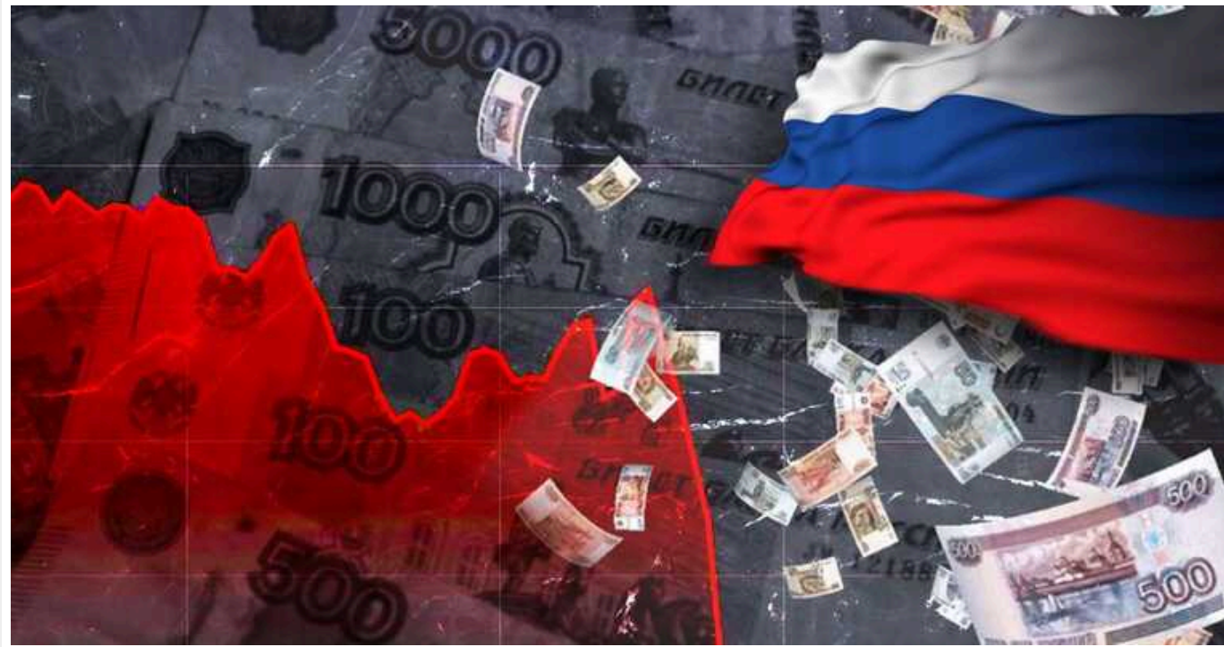
Стійкість економіки РФ "приголомшила" експертів, які вважали, що вже перший раунд санкцій призведе до її катастрофи

"Натомість, за їхніми словами, Кремль вибрався з рецесії, ухилившись від спроб Заходу обмежити його доходи від продажу енергоносіїв та нарощуючи витрати на оборону (які потроїлися – Ред.)."