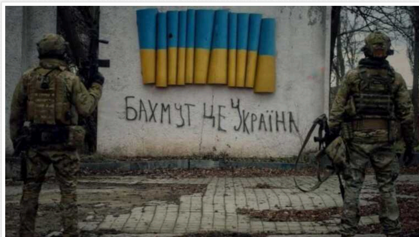
Збройні сили України мають просування під Бахмутом

За інформацією американського Інституту вивчення війни, ЗСУ просунулися на південний захід від Бахмута на Донеччині.