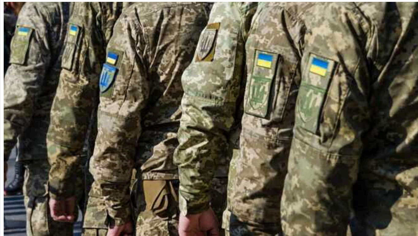
Коли стартує масова мобілізація: прогноз екскомандира батальйону "Айдар"

Масова мобілізація в Україні розпочнеться вже навесні, якщо Верховна Рада на той час встигне проголосувати за новий законопроект.