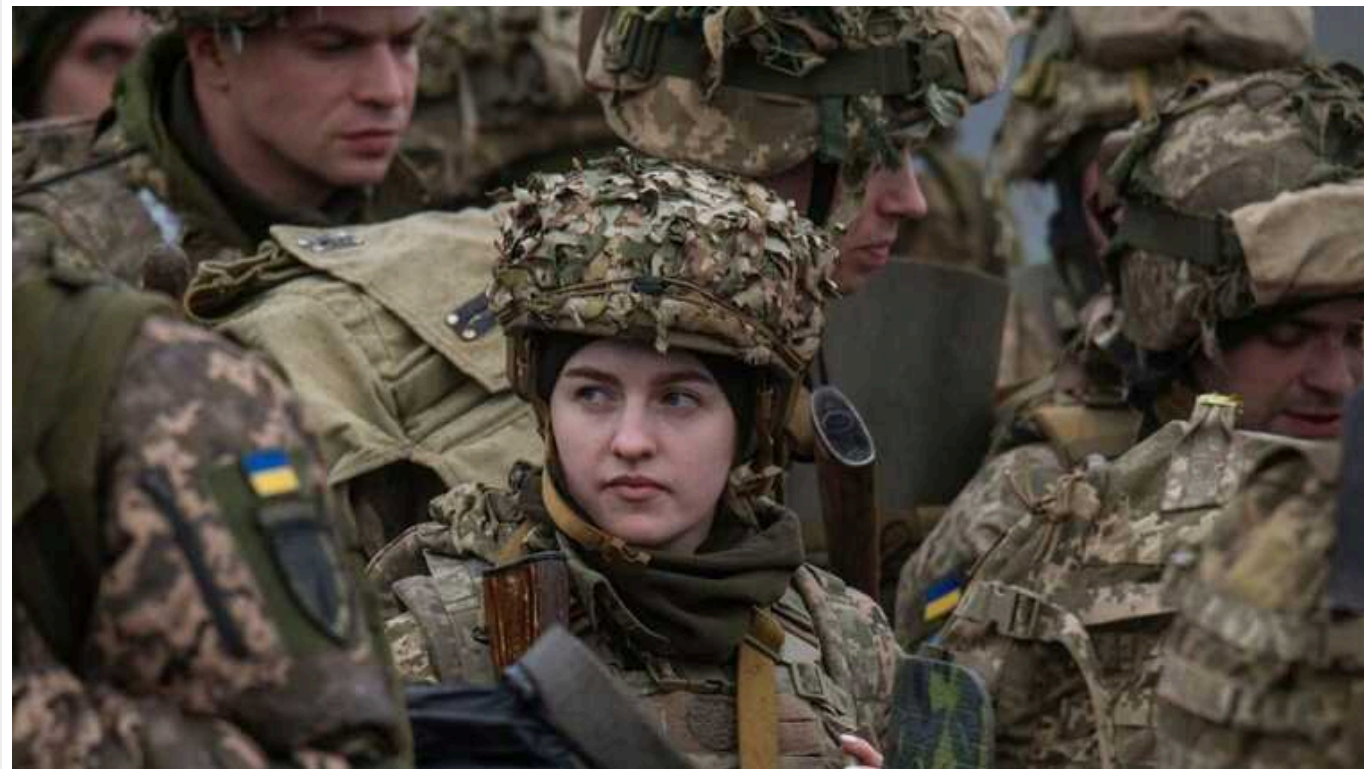
У Центрі стратегічних комунікацій спростували черговий російський фейк про "мобілізацію жінок"

Російські пропагандисти поширюють новий фейк, що нібито медичних працівниць київських лікарень примусово мобілізували та відправили на полігон для проходження курсів бойової підготовки. Центр стратегічних комунікацій та інформаційної безпеки спростував цю інформацію і прояснив ситуацію.