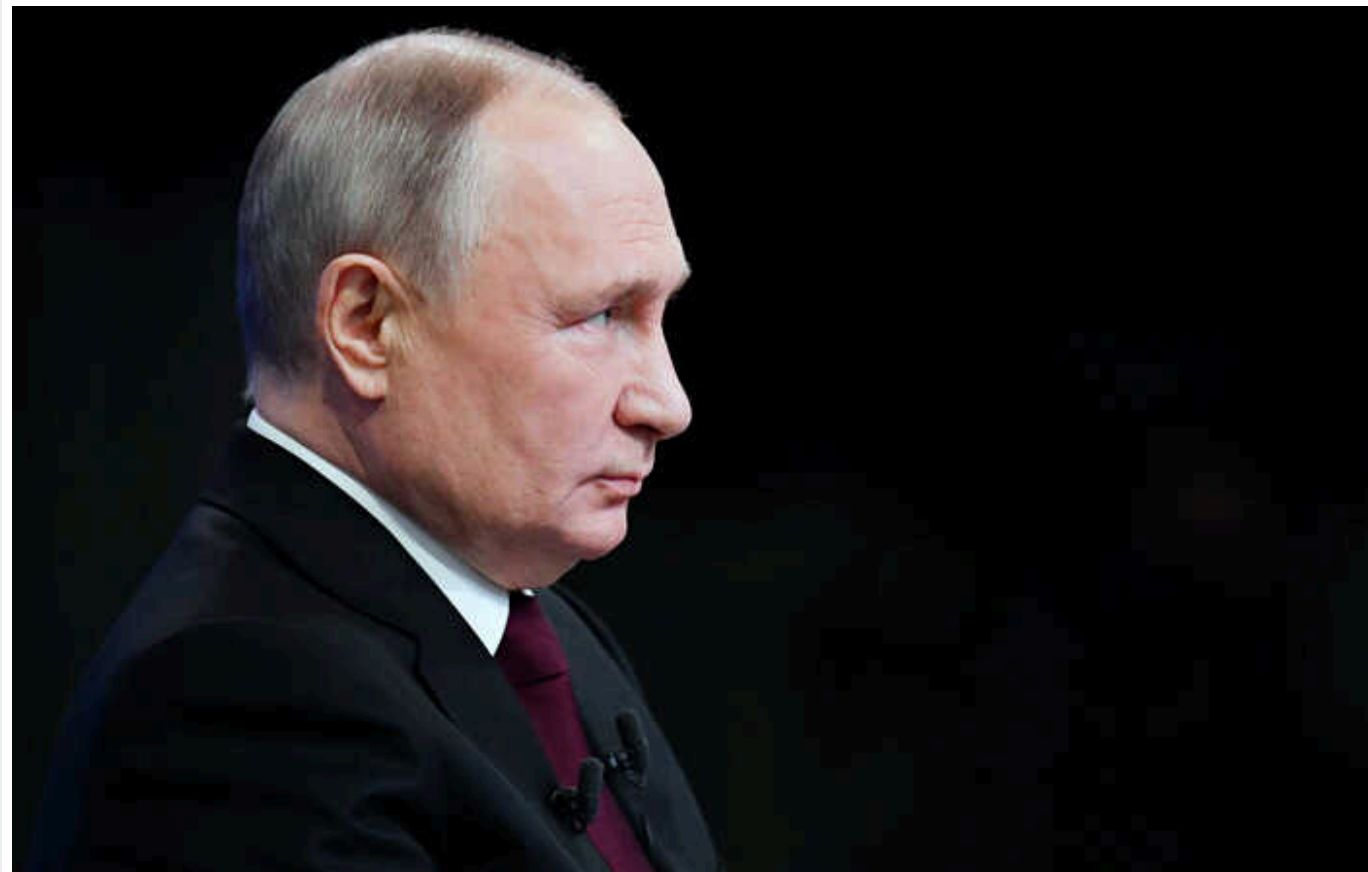
Російська пропаганда запустила фейк із новим "експертом": "Захід програв у боротьбі проти Путіна"

Кремлівська пропаганда продовжує поширювати міфи про "непереможність" свого військово-промислового комплексу. Більше того, у РФ видали легенду, що Захід нібито вже програв боротьбу із диктатором Володимиром Путіним.