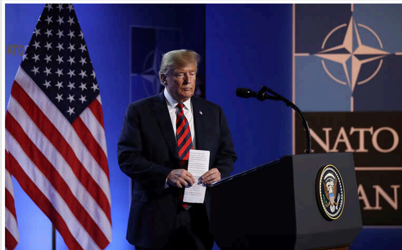
Перспектива переобрання Трампа президентом США ставить під загрозу існування НАТО, – New York Times

Перспектива переобрання Трампа президентом США змушує німецьких чиновників та багатьох їхніх колег по НАТО неофіційно обговорювати, чи зможе Альянс продовжити існувати, якщо Сполучені Штати його покинуть.