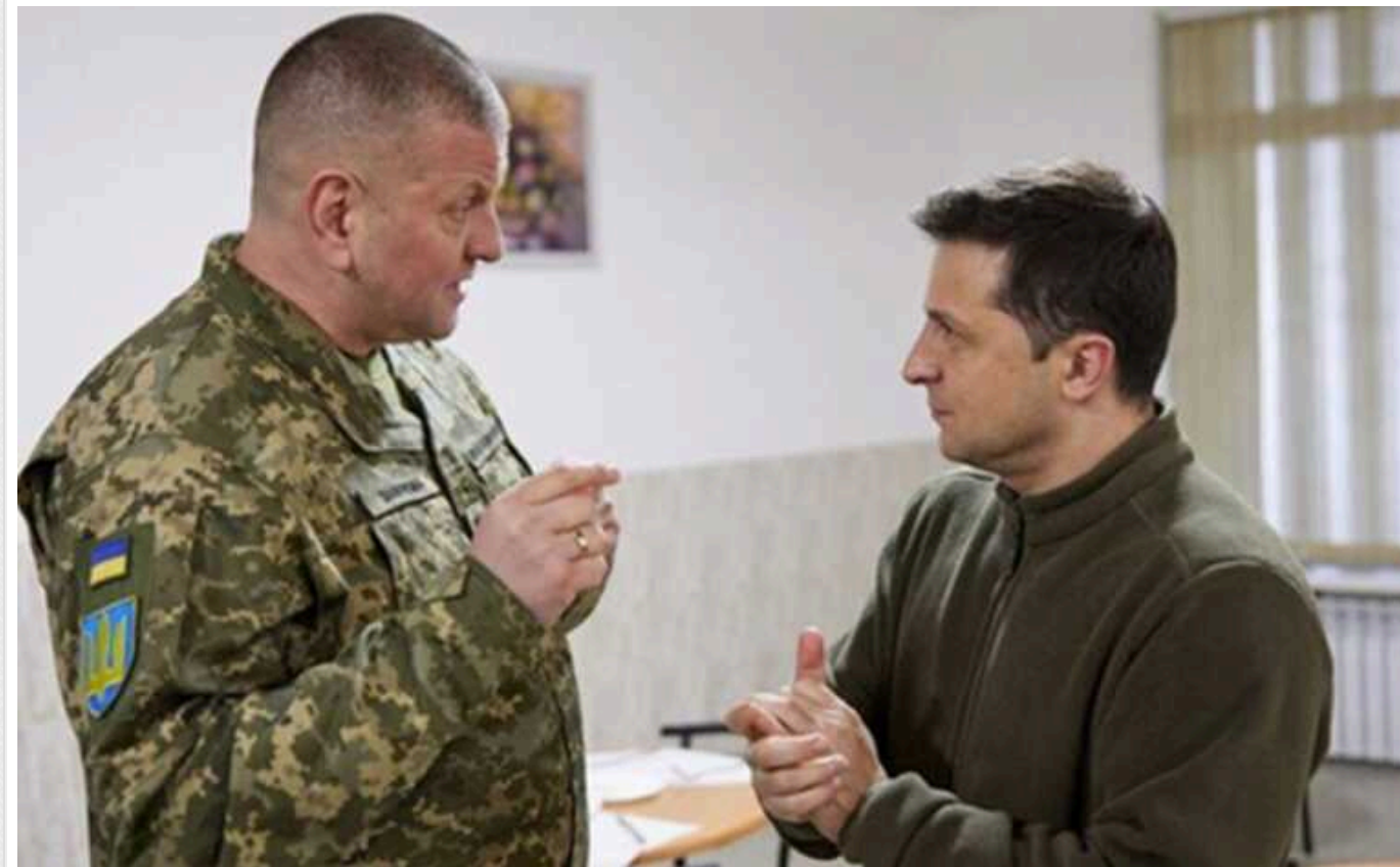
Bloomberg: Головом Залужний став проблемою для Зеленського

Перед Зеленським стоїть справжня дилема. Йому потрібно прийняти правильне рішення – за цим стежить вся країна.