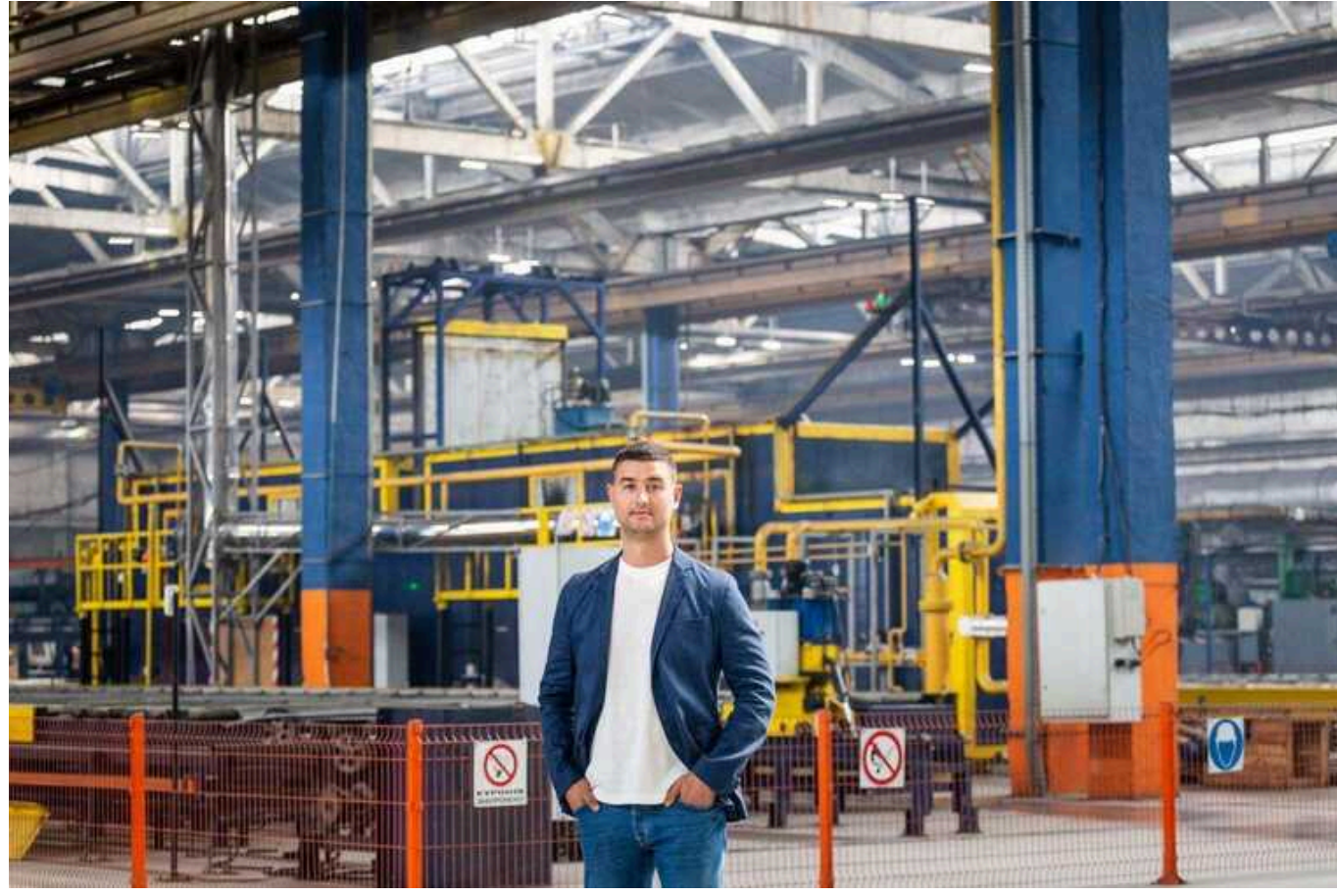
Група компаній «Шапран Груп» стала учасником НАДПУ