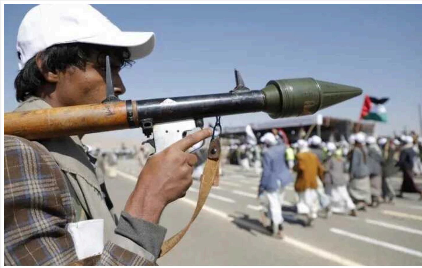
США, Британія та союзники знову вдарили по хуситах в Ємені: у Пентагоні розповіли подробиці

США та Британія завдали нового удару по позиціях, пов'язаних з Іраном, хуситів в Ємені. Удари були по 36 цілях у 13 різних місцях.