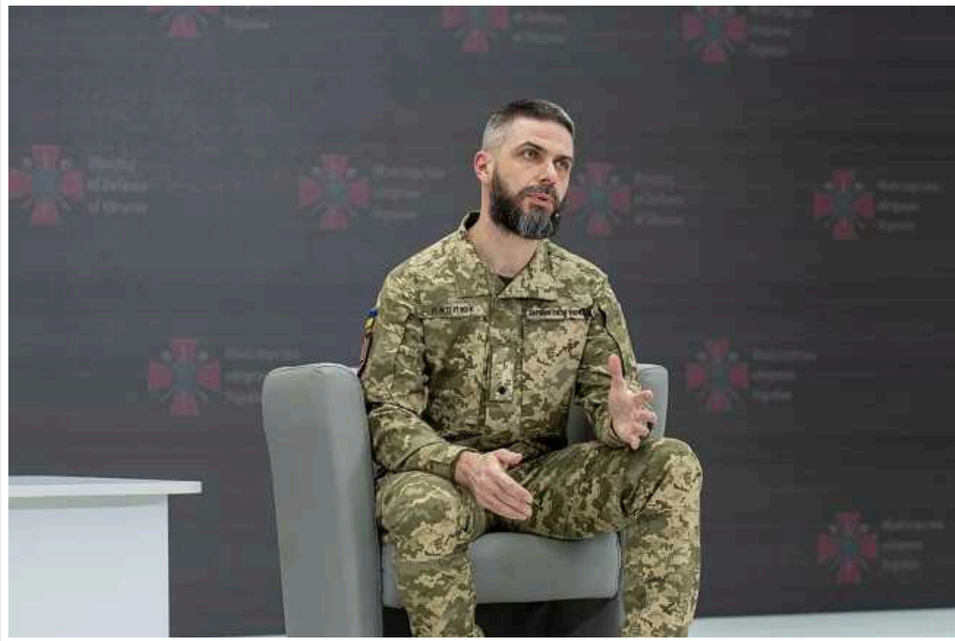
Речник Міноборони про обмеження для ухиялєнтів: Не покарання, а необхідність

Міністерство оборони пропонує нові обмеження для ухиялєнтів. Важливо, що вони не є "покаранням", як про це розповідають у мережі, а – необхідним кроком, зокрема, для забезпечення демобілізації військових у чітко визначений термін.