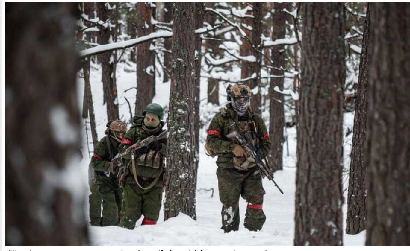
ДРГ росіян намагалася прорвати кордон у Сумській області: бій тривав півтори години

Російська ДРГ зробила чергову спробу прорвати кордон України на Сумщині 3 лютого. Ворог кілька разів змінював тактику, після півторагодинного бою окупантів вдалося відкинути далеко від кордону.