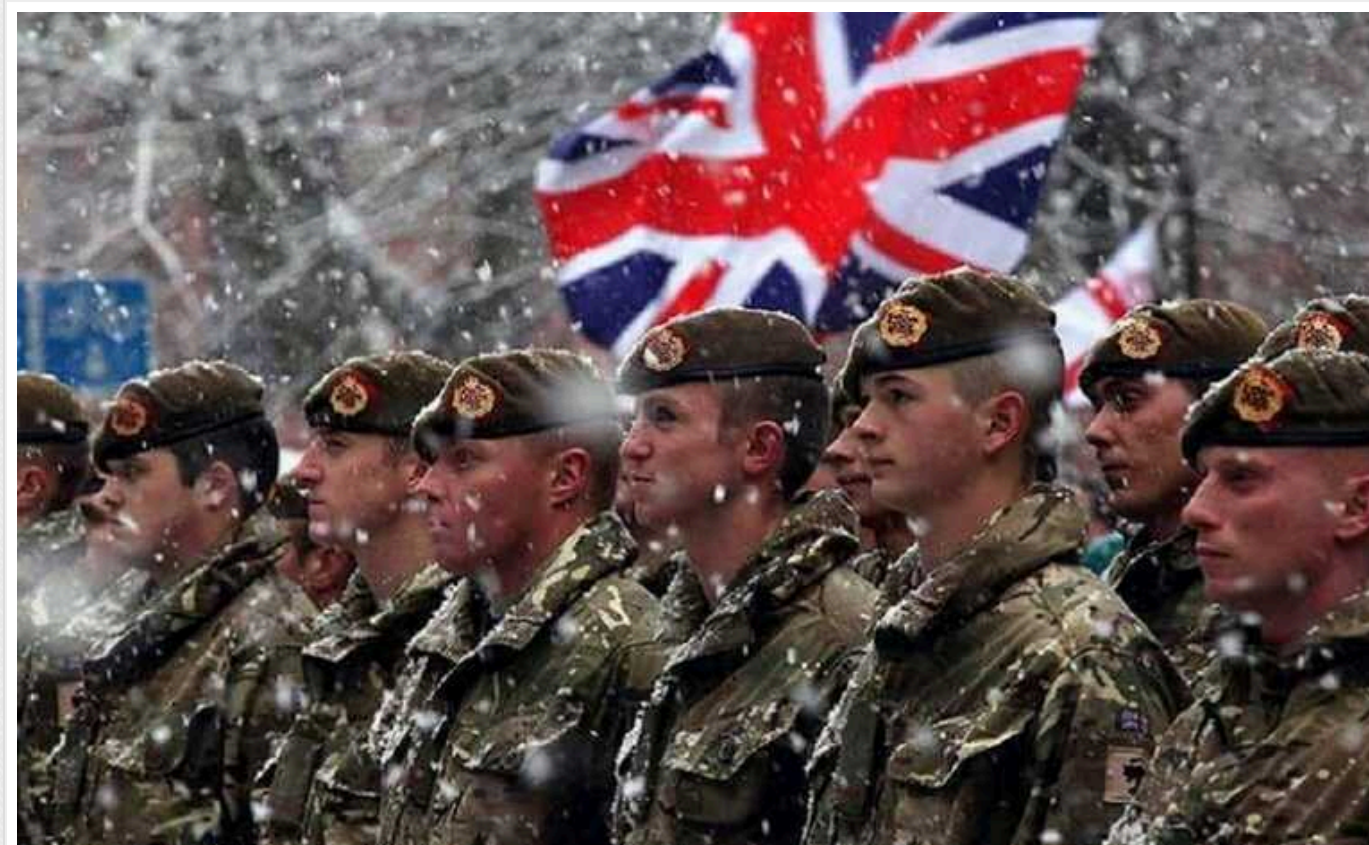
Армія Великобританії не готова до повномасштабної війни, - депутати парламенту

Депутати парламенту Великобританії наголосили, що військові країни недостатньо готові до ведення повномасштабної війни. Це підвищує ризик, що британські Збройні сили вичерпають свої можливості після перших кількох місяців війни "рівний-рівному".