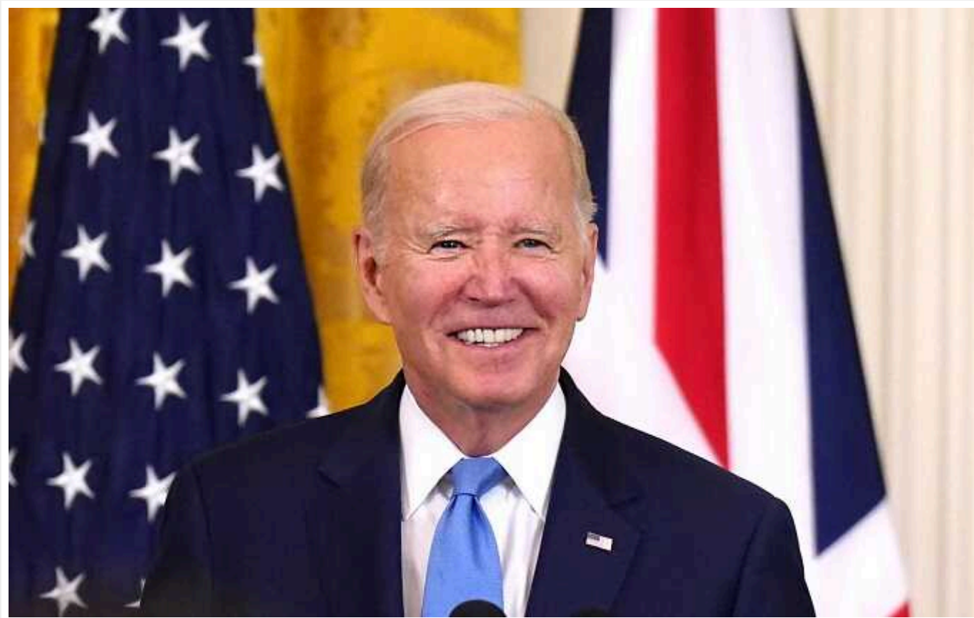
Джо Байден перемагає на праймерізі у Південній Кароліні

Джо Байден впевнено перемагає конкурентів із Демократичної партії на праймеріз (первинних виборах) у штаті Південна Кароліна. Він назвав перемогу важливим кроком у перемозі над своїм конкурентом Дональдом Трампом на президентських виборах 2024 року.