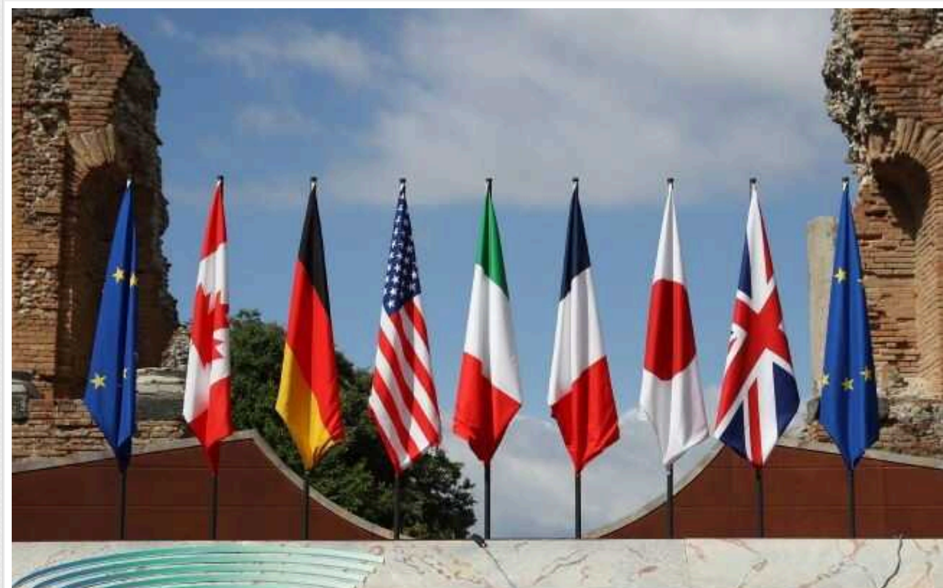
FT: Бельгія запропонувала G7 план щодо розблокування активів Росії на користь України

Бельгія запропонувала країнам G7 план, який би дозволив розблокувати заморожені російські активи в Європі. Їх хочуть використати на користь України.